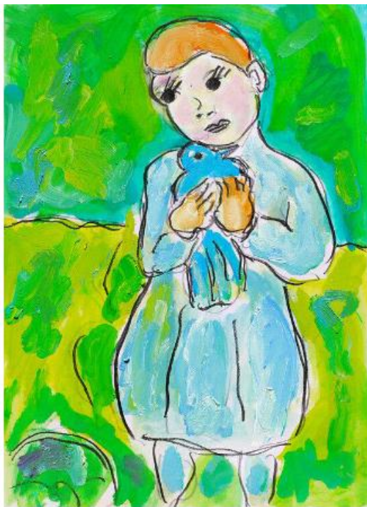
Enfant au pigeon d'après Picasso 1901 Jean Mirre, Frankrijk, 2023 Olie, Potlood op Papier, 30x21cm